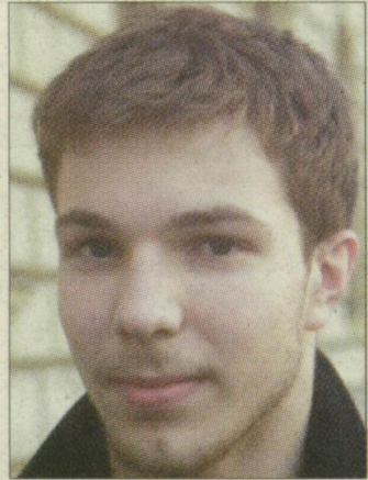
TÓTH ÁKOS zenész:

– Igen, szoktam teázni. Legtöbbször otthon főzök magamnak, és elkortyolgatom. Naponta több bögrével is elfogyasztok, a kedvencem a citromos tea. Akkor a legfinomabb, ha telerakom sok-sok citromkarikával. Teaházba, kávézóba nem sűrűn járok, hiszen nagyon elfoglalt vagyok, és nincs időm elmenni.