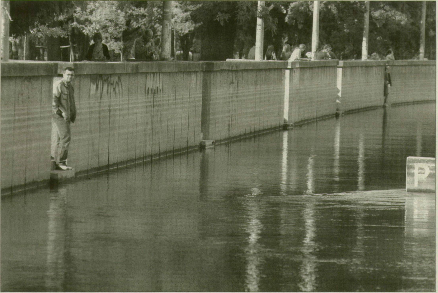
Ilyen volt a tavalyi ár idején a szegedi Tisza-part. Fény derült a harmincéves szerkezet gyenge pontjaira is