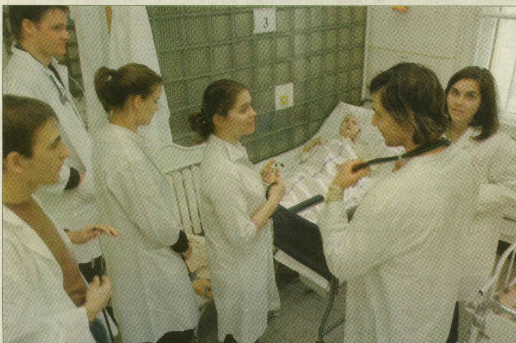
Orvostanhallgatók. Túl nagy lesz a teher...