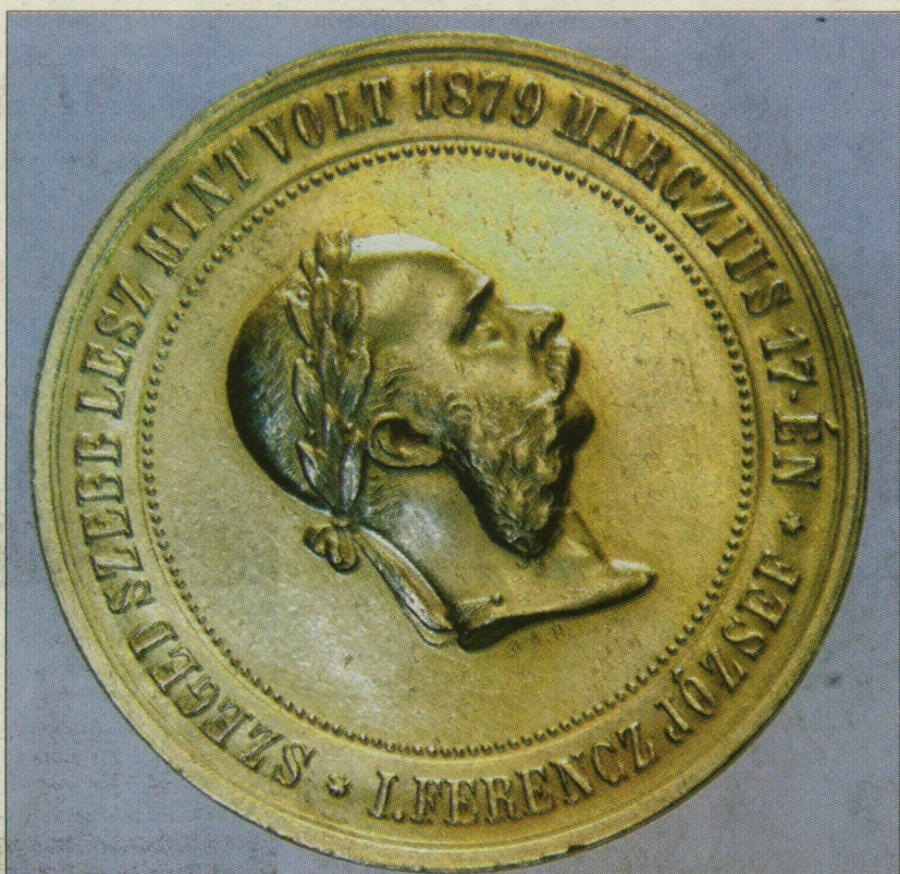
Egy ilyen Ferenc József-érme lappang még valahol

Legújabb szerzeményét a múzeum március 12-én, a nagy árvíz évfordulóján, ünnepségen mutatja be. Erre az alkalomra újraöntik az érmét – csokoládéból.