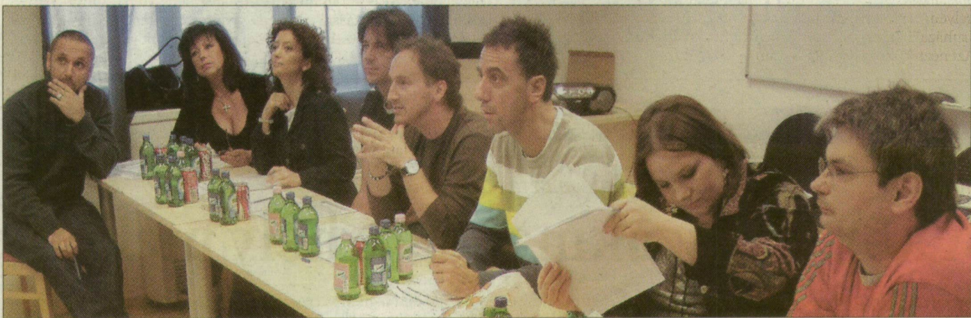
A zsűriben csupa ismert sztár hallgatja, mustrálja a lányokat