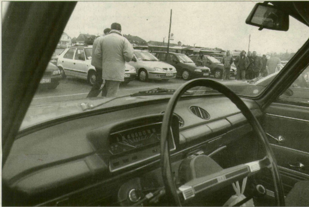
Használt autók a Cserepes sori piacon