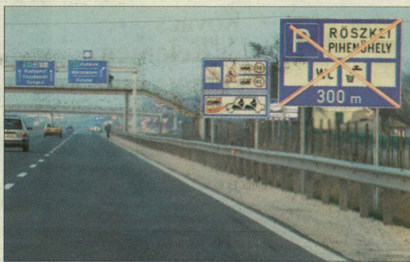
A röszei pihenő sorsa még a bíróságtól függ