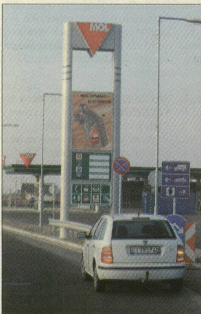
Szatymaznál már ott a kút, de még nem működik

Még belátható ideig nem épül meg az M5-ös röszei pihenője, az úgynevezett országkapu, a terület kisajátítása miatt ugyanis tovább pereskedik az állammal a tulajdonos. A sztráda átadásának első évfordulójára az ügyben már két jogerős bírósági ítélet született, de a vitának nincs vége.