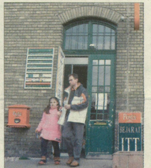
Az állomás postája marad