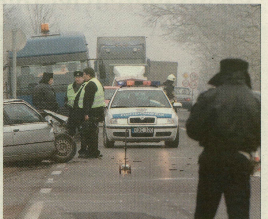
Gyakori a súlyos baleset Szeged és Vásárhely között