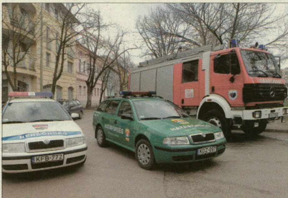
Több szirénázó autó kellene

Előreláthatólag nem jelent majd fennakadást a szerdai sztrájk a megyei közlekedésben. Az országos szakszervezetek támogatják a közszféra megmozdulását, de az autóbusz-vezetők független megyei szakszervezete, a közúti közlekedők szakszervezete, az SZKT munkástanácsa és megeyénkben a közlekedési szakszervezetek nem szünteti be a munkát.