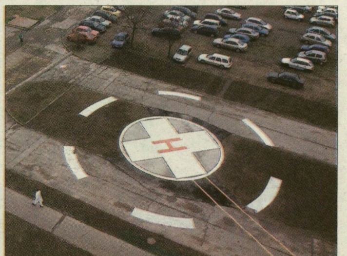
Mintegy 7 millióból hozták létre