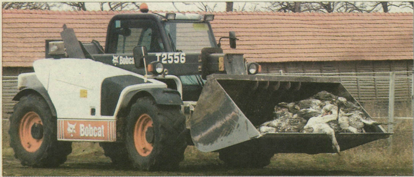
A pusztítás lapistói pillanatai. A két Szentés környéki telepről nem vittek baromfit Angliába – de még a Sá-Gához sem

Magyarországra is érkezett hűskészítmény arról az angol telepről, ahol 160 ezer pulykát vágtak le madárinfluenza miatt – közölte a magyar állat-egészségügyi hivatal. Az angol hatóságok szerint viszont a vírus tőlünk került a szigetországba. A Csongrád megyei főállatorvos lapunknak nyilatkozva kijelentette: a Szentés környéki telepekről nem szállítottak szárnyast Nagy-Britanniába, de még a Sá-Ga magyar vágóhídjára sem, az angol-magyar vita háttérben gazdasági érdekek állnak.