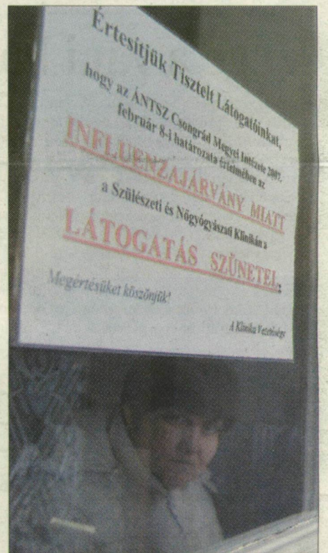
Ez a tábla fogadja a látogatókat a klinika kapuján