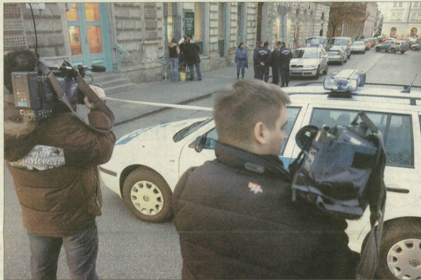
Rendőrök és riporterek a kiürített Victor Hugo utcán