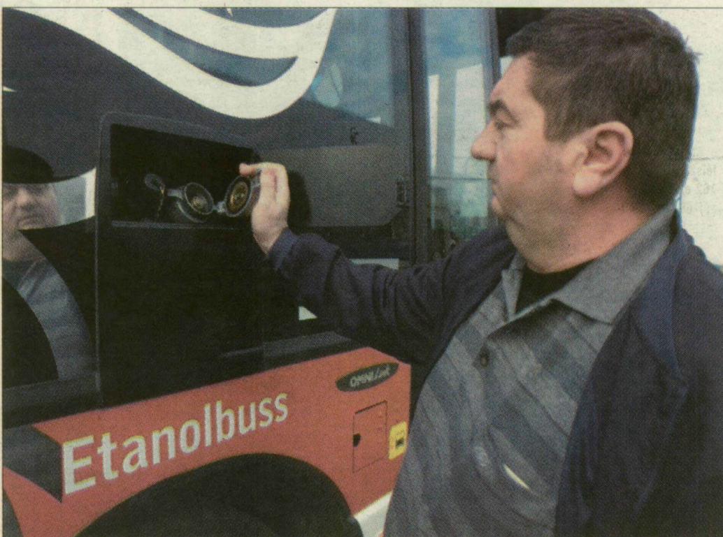
A buszba bioetanolt kell tankolni

– Egyelőre csak svéd mérésekre tudunk hagyatkozni, melyek