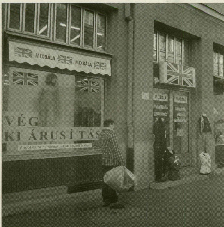
A belvárosi, Kiss Menyhért utcai kirakatok nem nevezhetnének be egy szépségversenybe