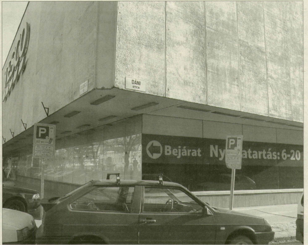
Az alsó szint még üres, az első emeletre lakberendezési áruház költözött