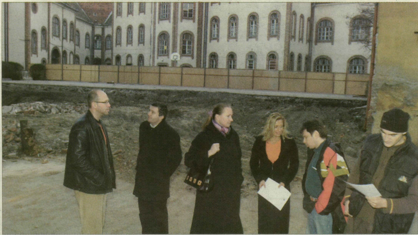
Öregdiákok helyett jobbra politikusok demonstráltak