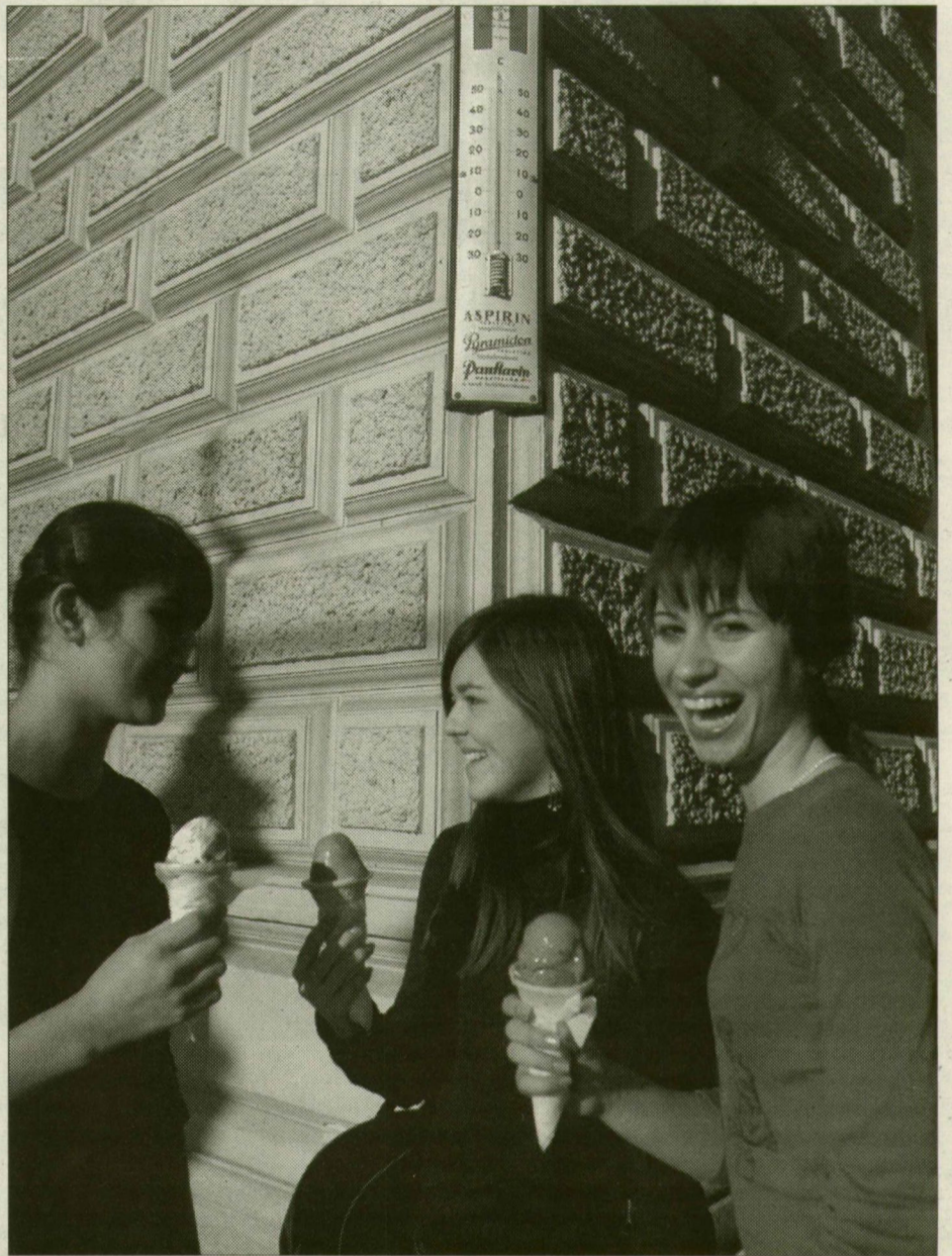
Fagyaltszezon? Szegeden a napsütötte helyeken az idén már 20 fok fölé is felkúszott a hőmérő higanyszála

■ Az 1728-as nagy szegedi boszorkányperben tizenhárom embert égettek meg. Egyiküket, a nyolcvankét éves Rózsa Dániel korábbi főbíróért ítélték el, mert az ördöggel cimborált. A vádirat szerint azért győzött Szegedet hét aszályos év, mert Rózsa eladta a törököknek a harmatot, az esőt és a havat. A történészek szerint az szúrhatott szemet a környezetének, hogy feleséggel vett egy harminc évvel ifjabb asszonyt.