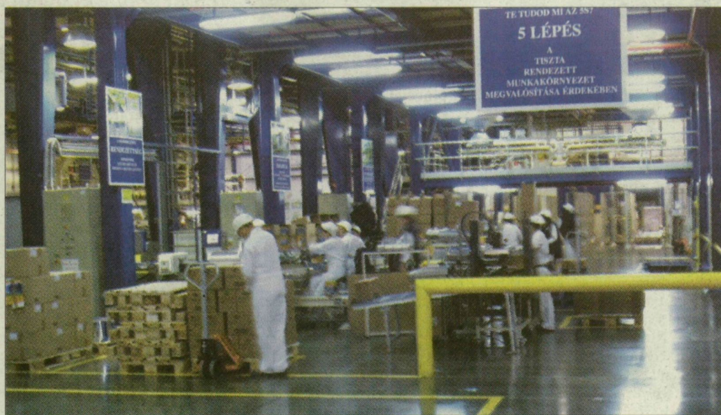
Állateledeleket készítenek a gyárban