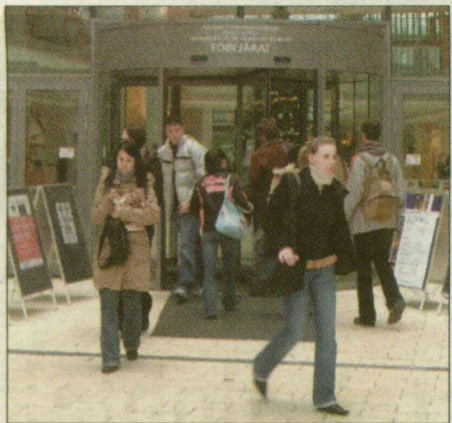
Egyetemisták a TIK előtt

A HÖÖK álláspontja, hogy a tehetséges hallgatókat kell támogatni, ezzel párhuzamosan mindenki számára szociális alapon is elérhetővé kell tenni a felsőoktatást, hogy minden kiemelkedő képességű tanulóknak legyen esélye bekerülni egyetemre, főiskolára. Ugyanakkor az egységesítés csökkenti a felsőoktatási intézmények között a juttatások formáiban még megmutatózó különbségeket. A kormányrendelet arról is határoz, hogy a befizetett tandíj felét az intézményeknek tanulmányi ösztöndíjra kell fordítaniuk. Ez azt eredményezi, hogy 2008-tól emelkedik majd az ösztöndíjak mértéke is. Ugyanakkor szól arról az átjárhatóságról, mely szerint az államilag támogatott képzésben részesülő diákok közül a legrosszabbul tanuló 15 százalék helyet cserél a költségtérítések legjobb eredményeket fölmutató 15 százalékával.