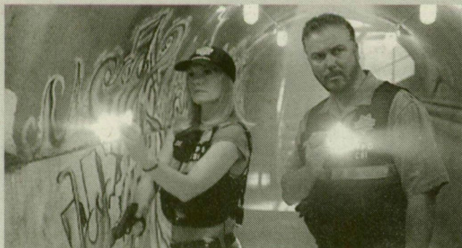
Marg Helgenberger (Catherine Willows) és William L. Petersen (Gil Grissom) A helyszínelők című sorozatban

A C.S.I. (Crime Scene Investigation), vagyis A helyszínelők filmsorozat történeteinek szereplői nem riadnak vissza a lőtt sebek, az ömlő vér és az anatómiai kuriózumok látványától sem. A C.S.I. olyan törvényszéki nyomozókról szól, akik a bűntények színhelyén dolgoznak, és munkájuk igen kevésbé ismert az átlagember számára. Az akcióinak a társadalom olyan rétegei is rendszeres nézőivé váltak, melyek amúgy nem néznének krimisorozatokat. A helyszínelőket a világ 21 országában játsszák nagy sikerrel. Nálunk a VIASAT3 adón ma 21.45 (ismétlés: vasárnapra virradóan 02.35); holnap 22.00 (ismétlés hétfőre virradóan 02.10) órakor kezdődik a színes, magyarul beszélő, 2000-ben született amerikai-kanadai akciófilm-sorozat egy-egy epizódja, mely 16 éven aluliak számára nem ajánlott.