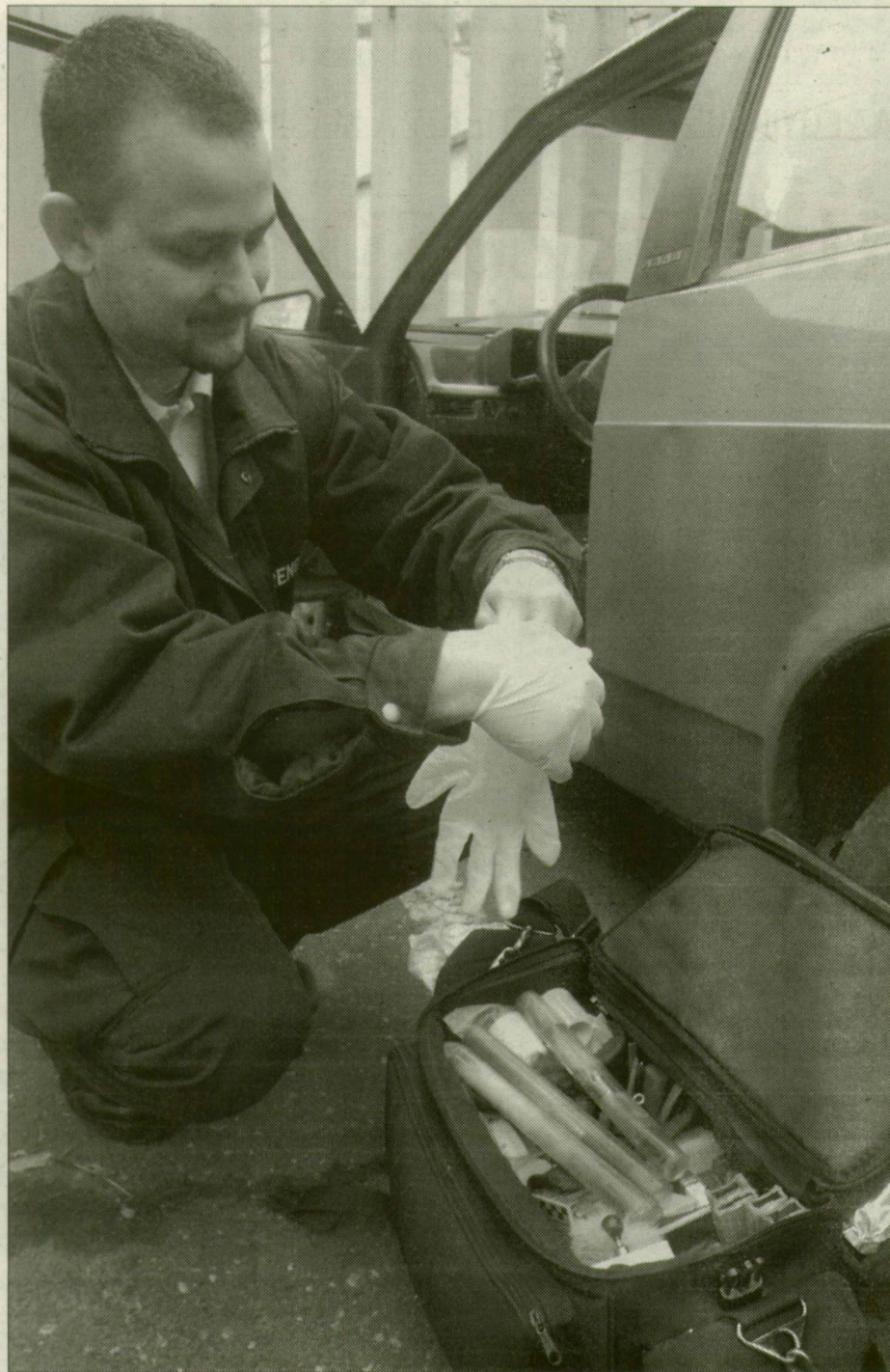
A szegedi nyomrögzítők készletű bőröndje hasonlít a filmbelire

A helyszínelők ébersége hozott gyors megoldást egy idős asszony halála ügyében. Vérbe fagyva, holtan találtak az utcán egy nyolcvan év körüli mozgás-sérült asszonyt. Múlába és a járkerete előkerült a házban, ezek nélkül nem mehettek ki. Végül rájöttek, hogy az asszony, segítségét hátrahagyva, felkúszott a padlásra, elhúzott néhány cserepet, és kivetetette magát. Öngyilkos lett, nem gyilkosság áldozata.