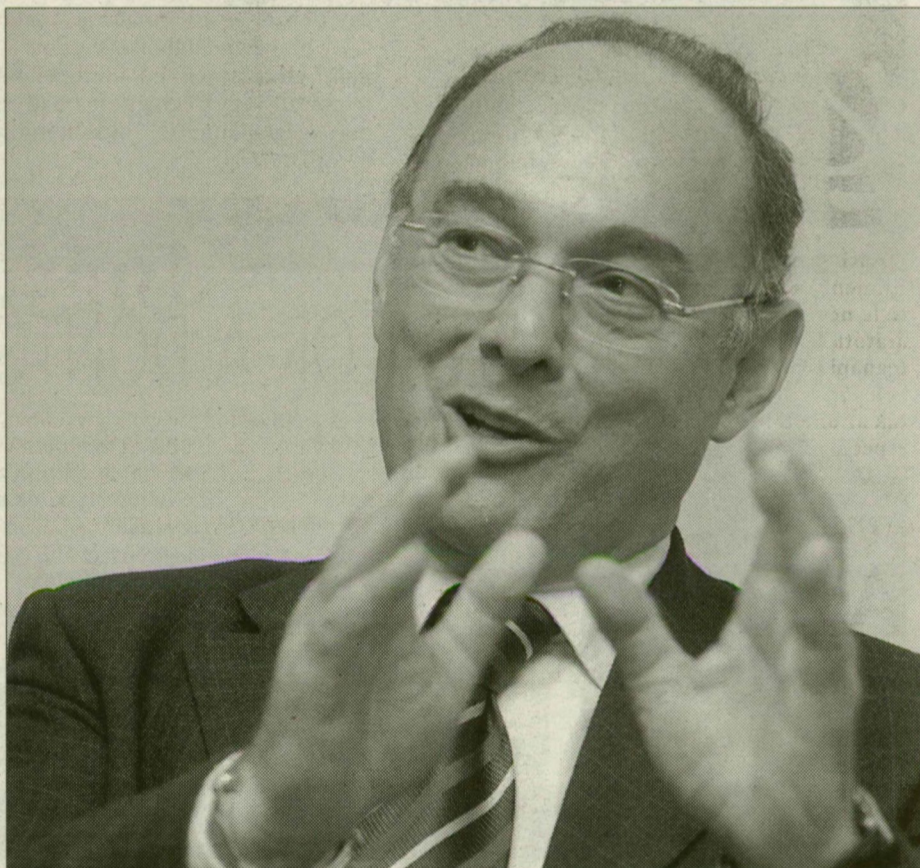
A honvédelmi miniszter sikeresnek tartja a tárca munkáját

A haderőreform Szekeres szerint jól halad, a modernizálás során céljuk az, hogy minél kisebb bürokráciával minél hatéko-