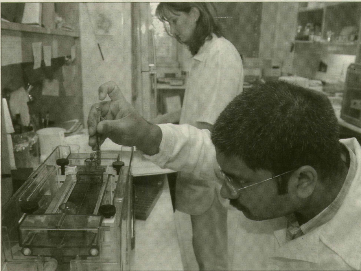
Rákkutató laboratórium a Szegedi Biológiai Központban

Milyen tudományos témakörökre vévő mostanában a világ, mire érdemes pályázni? Továbbra is menő a növénygenomika és -nemesítés az SZBK szerve-