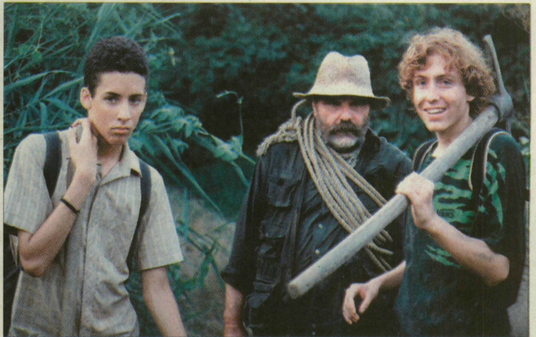
Jelenet a filmből

A képi anyag, az ismerős tájak, a vízi madarakról felvett jelenetek látványa elkápráztatta az érdeklődőket, akik pozitívan nyilatkoztak a látottakról. A he-