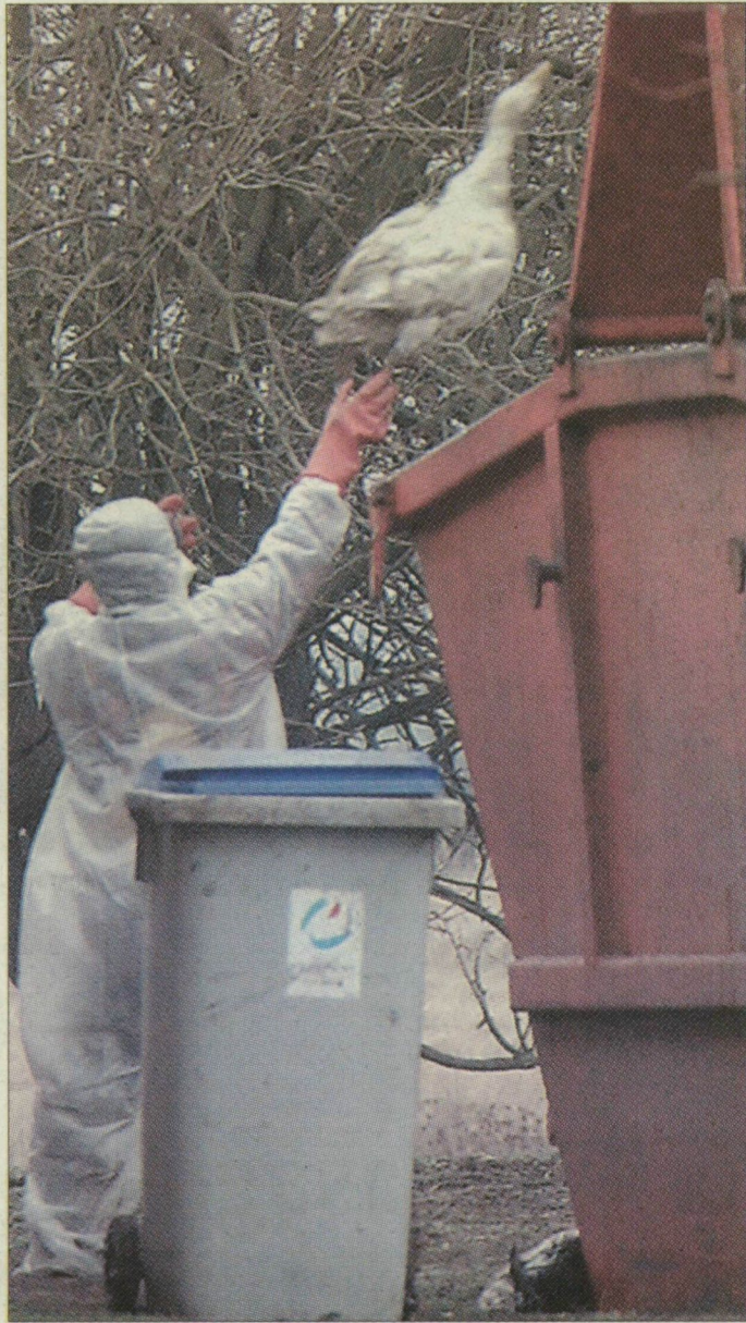
Az állat-egészségügyi hatóság védőruhába öltözött szakemberei tették konténerekbe a libatemeteket