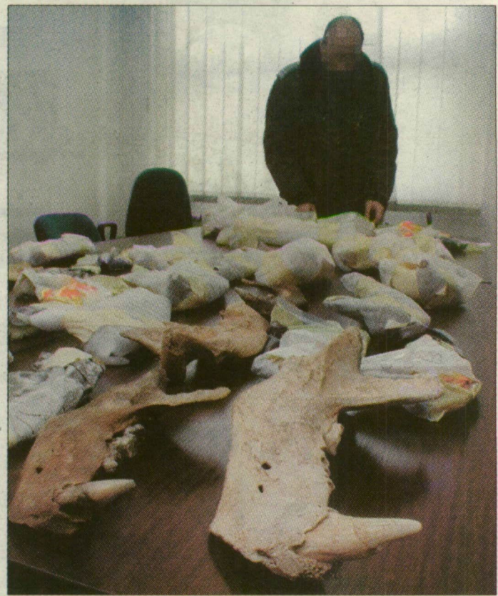
Barnamedve-állkapocs mint csempészárú. Ezt is Nagylaknál kobozták el a vámosok

Egyébként nemcsak a védett állatok származási helyének természetvédelmével, az ott élők környezettudatosságával van baj, hanem a célországokéval is. Hiszen az illegális állat- és növénykereskedelmet, a belőlük készített termékek kereskedelmét a piaci igények tartják életben. Ha a fogadó országokban, melyek legtöbbször nyugat-európaiak, megszűnne az ezekre irányuló igény, ez a csempészetnek is gátat vetne.