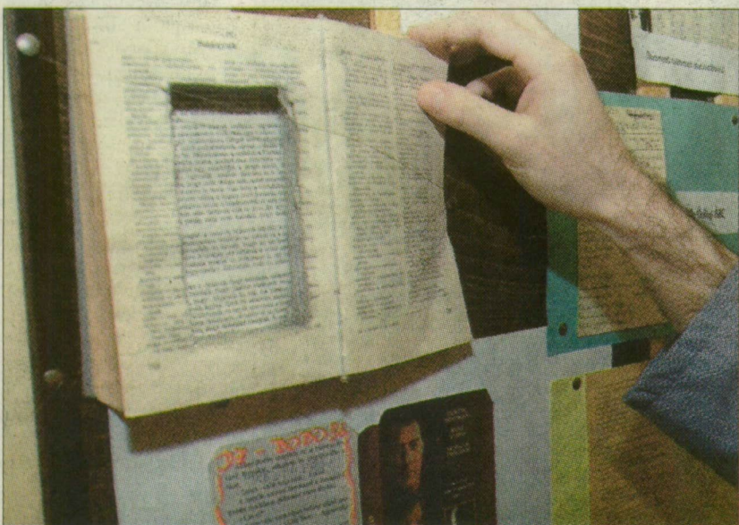
A latin szótárban mobiltelefont rejtett el az egyik rab

az elítéltek ugyanis a zárkában olvasólámpát is használhatnak.