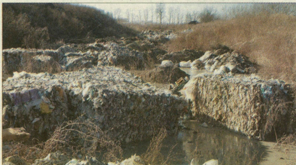
A bálákat háztartási hulladékkal és iszappal takarták be