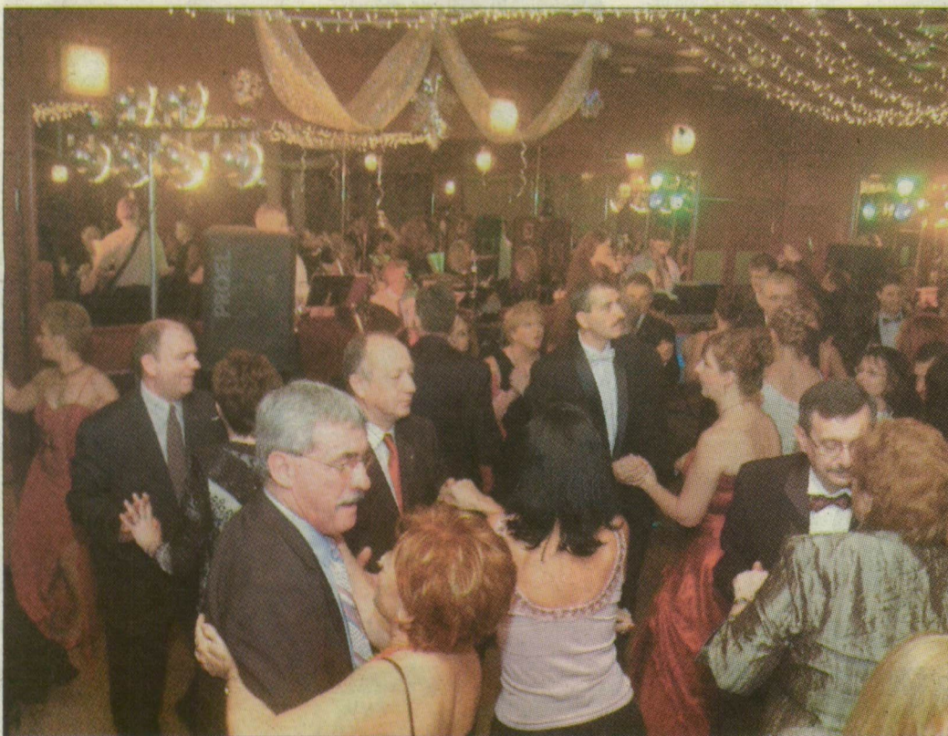
Hajnalig tartott a multság