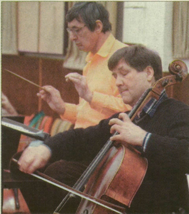
Onczay Csaba Kossuth-díjas gordonkaművész Szegedről indulva hódította meg a világot