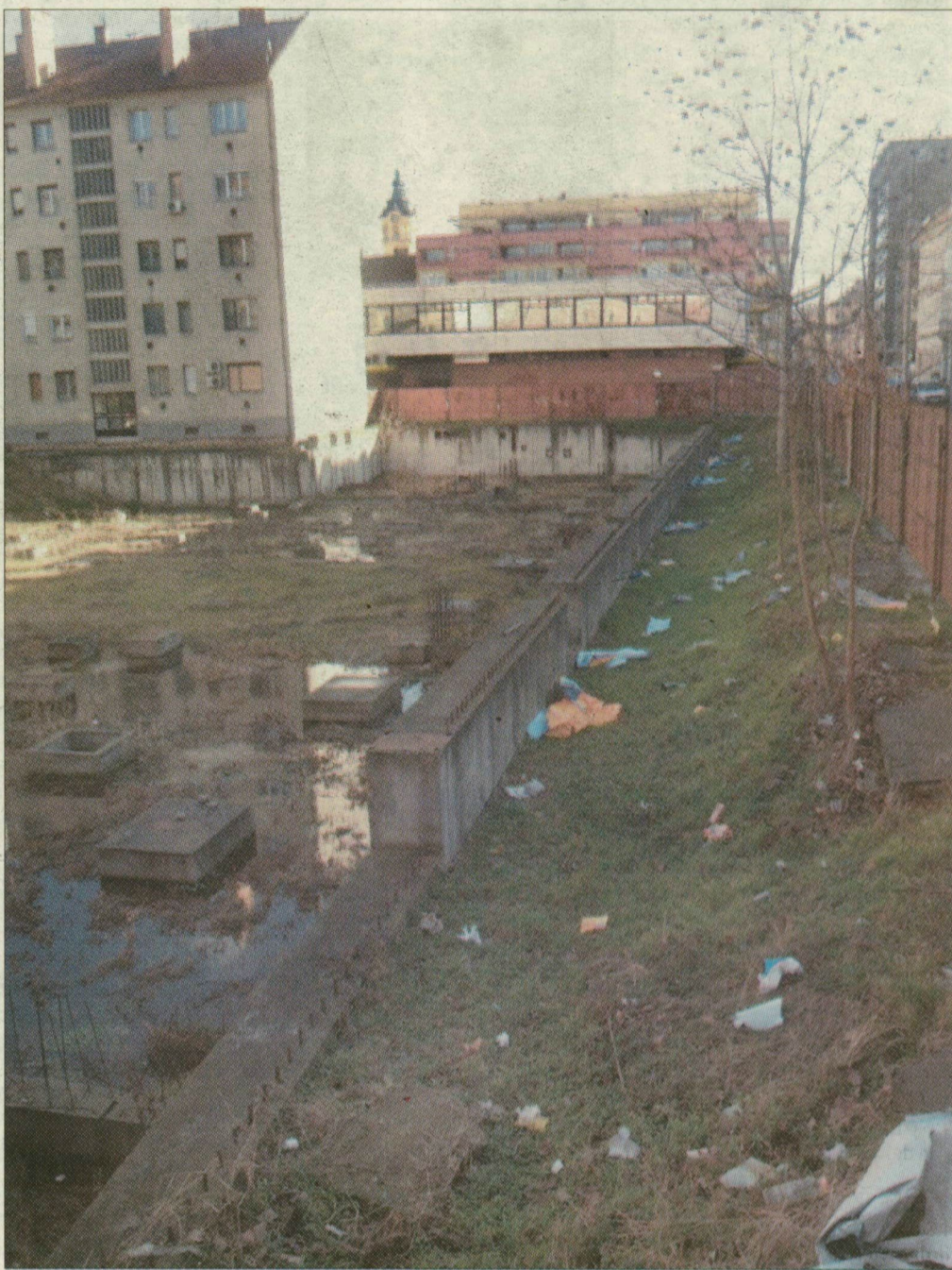
Szégyenfolt a centrumban, az egykori Centrum mögött