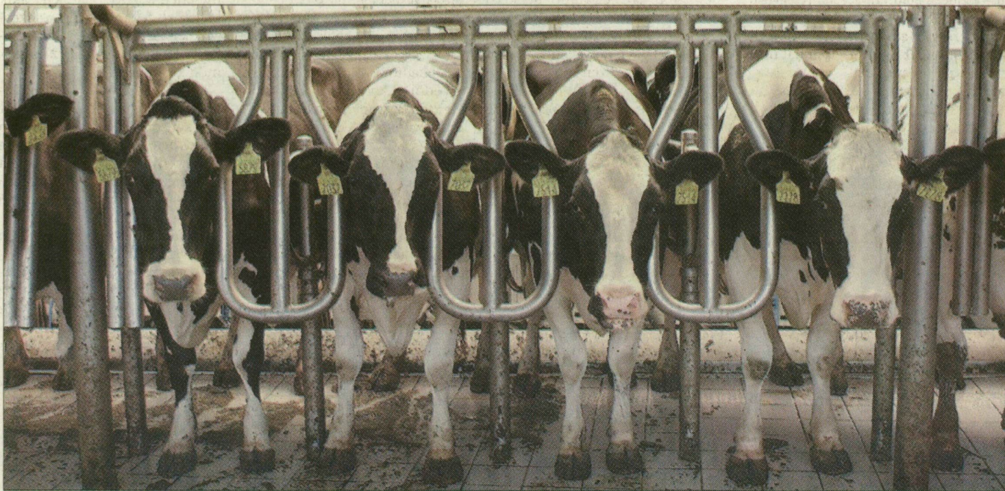
A Hód-Mezőgazda Rt. vajhái teheneitől Székesfehérvárra, onnan esetleg Romániába vezet a „tejút”