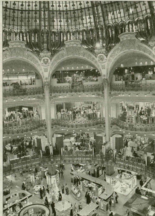
Valóban a párizsi La Fayette lesz a minta?

A szegedi Centrum dolgozói 1993-94 során kárpótlási jegy ellenében privatizálták az áruházat. Mivel a fejlesztéshez tökéletesre volt szükség, az elkövetkező másfél évben összeolvadtak a Centrum, és a már jelentős részben a német Tengelmann tulajdonában lévő Skála Áruházak, s vették fel a Skála Divatáruház nevet. Különböző vállalatok egymástól a Skála ingatlanhasznosító céget, valamint magát a hálózatot. A Tengelmann 2001-ben vonult ki a magyar piacról, s a kínai cég belépéséig, 2005-ig különböző bérlők üzemeltették az áruházakat. Az ES Holding Kft. a Skála Ingatlanhasznosító Zrt.-ből tavaly kivette a Skála Centrum Kft.-t vásárolta meg nemrégiben száz százalékosan, így szerezte meg hat – egy fővárosi és öt vidéki, köztük a szegedi – áruház tulajdonjogát. A többi, további tízenkettő Skála más befektetők kezében van, de mind a tízenyolcat a kínai Jin Wen Kft. bérlő. A kínaiak tavaly megvették az összes Skála névhasználati jogát is.