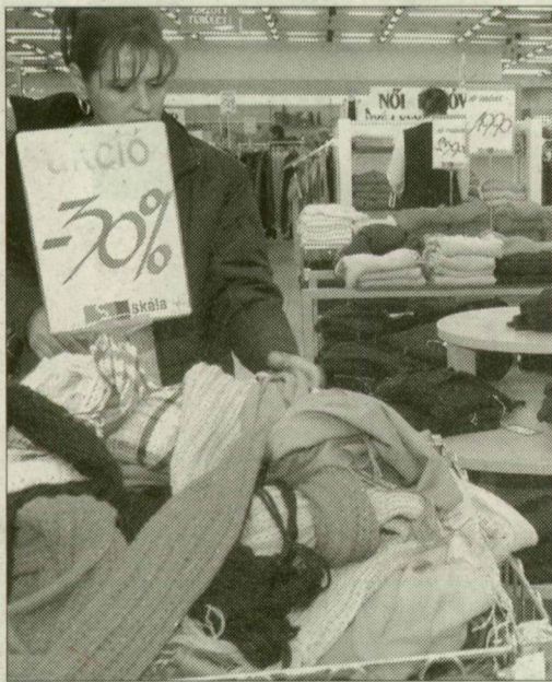
Akcio a szegedi Skálában

Az ingatlanfejlesztő cég lát fantáziát a szegedi Skála belvárosi fekvésében, mivel világtendencia, hogy