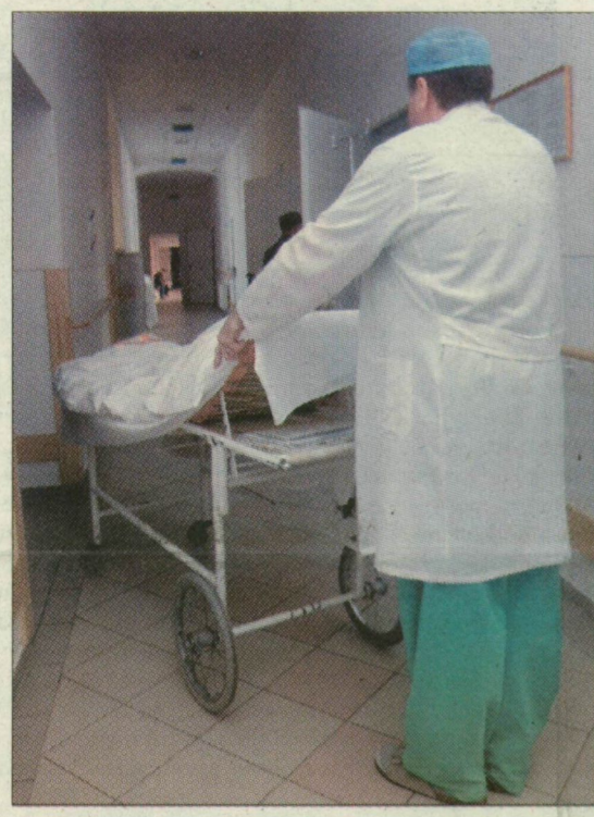
Húsz napon belül meg kellene egyezni a kórházakról a régióban

Hétszáz aktív ágyra pályázhat a deszki, a makói, a szegedi és a vásárhelyi kórház – az egészségügyi miniszter javaslata szerint. A súlyponti listáról lemaradt területi kórházak gyógyító ágyszámát jócskán megnyirbálta a szakárca. A javaslat szerint a szegedi kórház 193, a vásárhelyi intézmény pedig 154 aktív ágyat veszíthet, miközben a krónikus ágy számuk jócskán nő. A kormány célja, hogy a kiemelt kórházakba – megyénkben ilyen a szentesi kórház és a szegedi orvoscentrum – koncentrálja a gyógyító ágyak többségét, a kisebb kórházaknak pedig inkább idősek, krónikus betegek ápolására kell berendezkedniük. A „kicsik” helyzetét nehezíti, hogy a kiemelt is pályázhatnak a már garantált ágy számuk mellett újabb aktív ágyakra. A Bács-Kiskun, a Békés és Csongrád megyei területi kórházak sorsáról húsz napon belül határoznia kell a dél-alföldi regionális egészségügyi tanácsnak. – Olyan jelentősen kellett csökkenteni az ágy számot szinte minden intézményben, hogy csekély va-