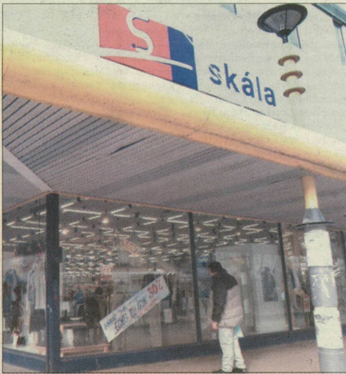
Skála: a tulajdonos változott, a bérlő maradt

A londoni Harrods és a párizsi La Fayette mintájára színvonalas áruházszertné átalakítani a szegedi Skálát az új tulajdonos. A Kecskeméti Malom Központban is érdekelt ES Holding Kft. ezzel a vásárlással csak az ingatlant szerzte meg, a bérlő idén még biztosan a kínai Jin Wen Kft. marad. A későbbi tervekről az új tulajdonos cég fejlesztési igazgatója elmondta: az áruészlet összetételében lényeges változásokra lehet számítani, s a Skála a szomszédos gödörrel együtt új funkciót kaphat, és a környék is jelentősen átalakulhat.