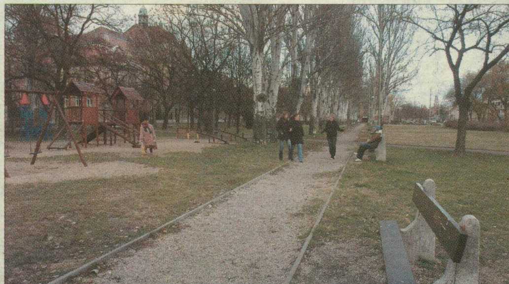
A Kálvária térre már igencsak ráfér a felújítás