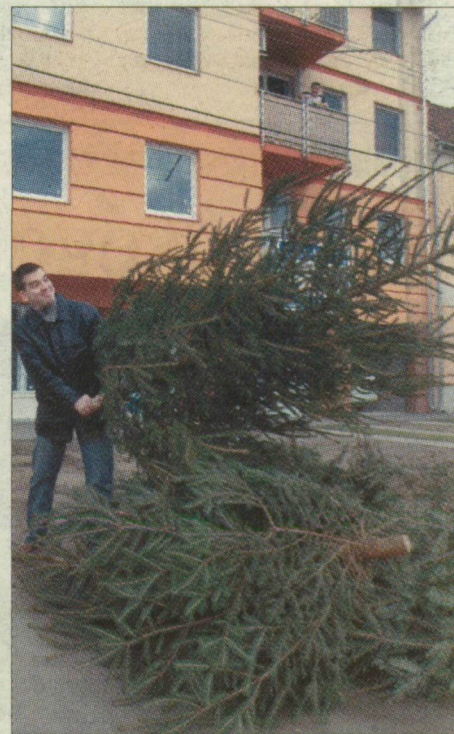
Utcan gyűlnék a fenyők