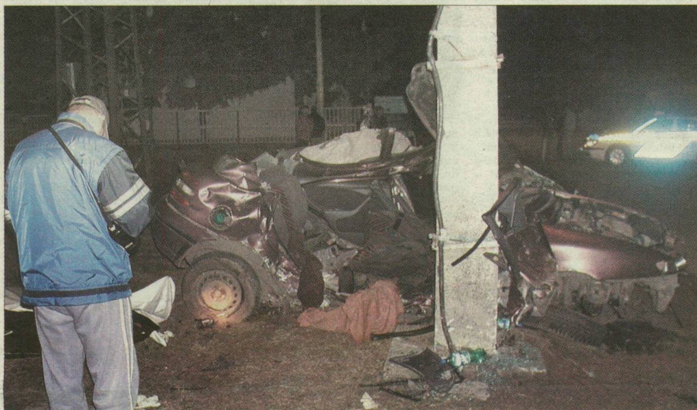
A villanyoszlopnak ütközött autó szinte kettészakadt