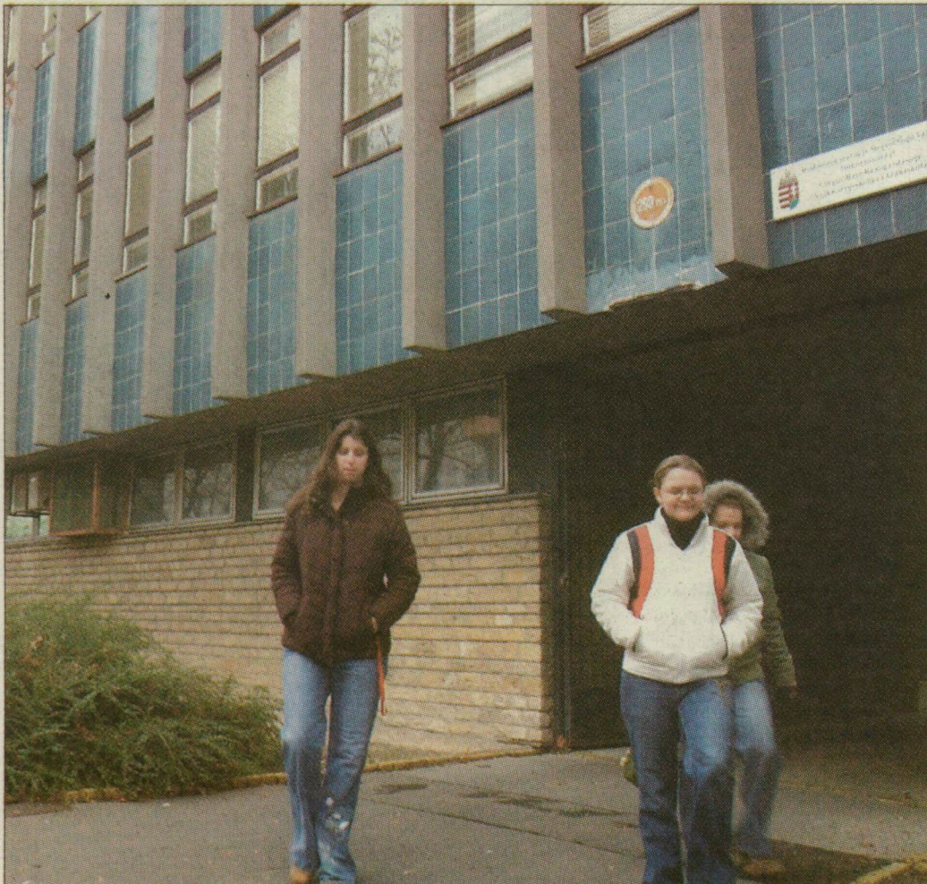
A diákok még semmit sem észleltek a történetekből