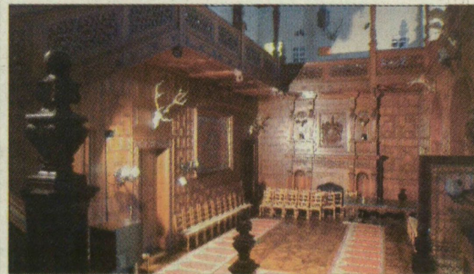
A kastély gyönyörű belső tere. Nem tudni, mikor költözhetnek az otthon lakói