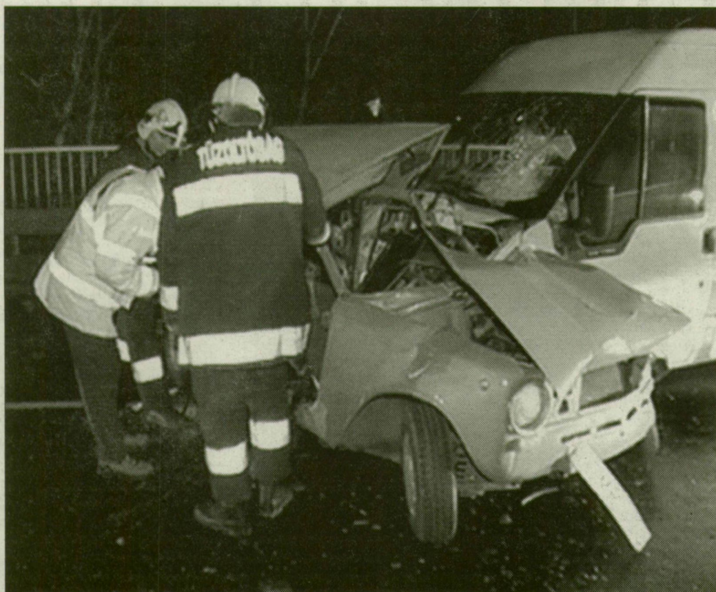
A Lada utasai be voltak kötve, hárman közülük mégis meghaltak