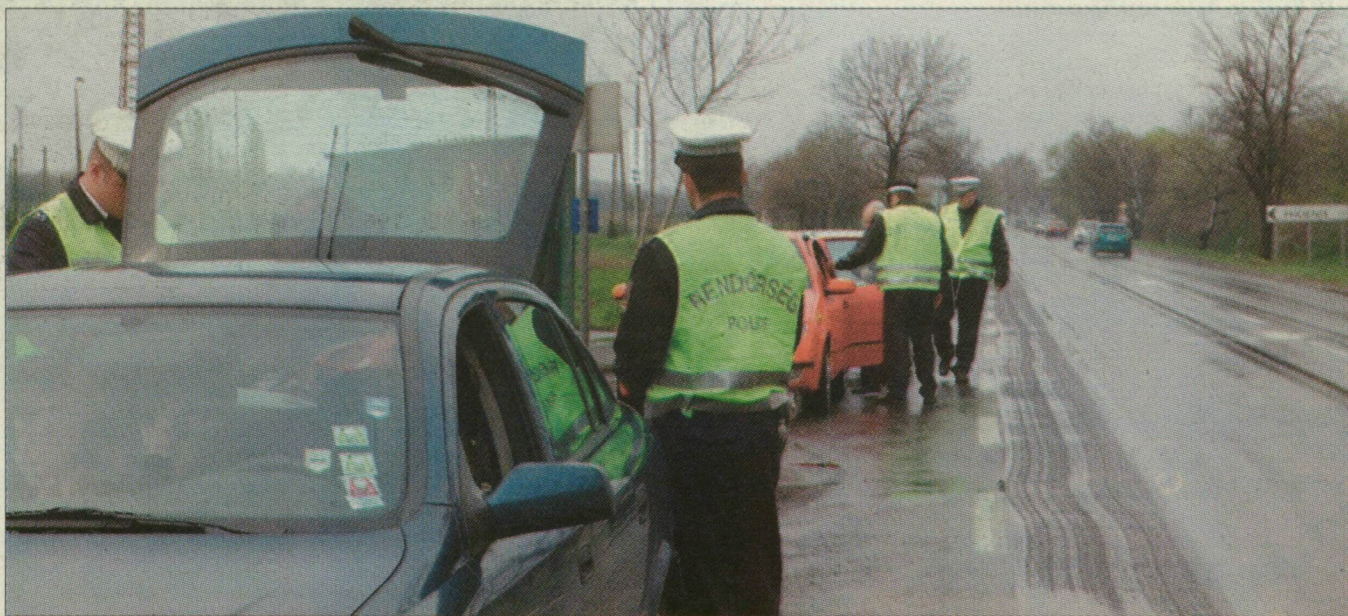
A hét elején fokozott ellenőrzések voltak az utakon

Csongrád megyében a lakott területek belüli útvonalakon, illetve a városokba ki- és bevezető főútvonalakon ellenőrizték a gépjárművezetőket. A kétnapos akcióban mintegy nyolcvan rendőr vett részt, akik napi nyolc órában 984 gépjármű vezetőjét szondáztatták meg. Közülük tizenegy fő ittasan ült a volán mögé, akik ellen büntetőeljárást indítottak. Kábító-, bódítószerek hatása alatt az igazoltatottak közül senki nem vezetett. Helyszíni bírság kiszabására ötvenkét esetben került sor, szabálysértési feljelentést huszonegy alkalommal tettek.