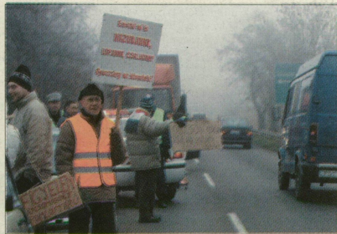
A kormány ellen mintegy százan tüntettek tegnap a Bajai úton