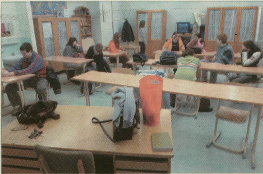
A szegedi egykori lila iskolában sem volt tanítás az első két órában

A tanári szobában nagyjából húsz-huszonöt pedagógus teázott, kávézott és beszélgetett. Senkinek nem jutott eszébe az üres két órában dolgozatot javítani vagy órára készülni – az