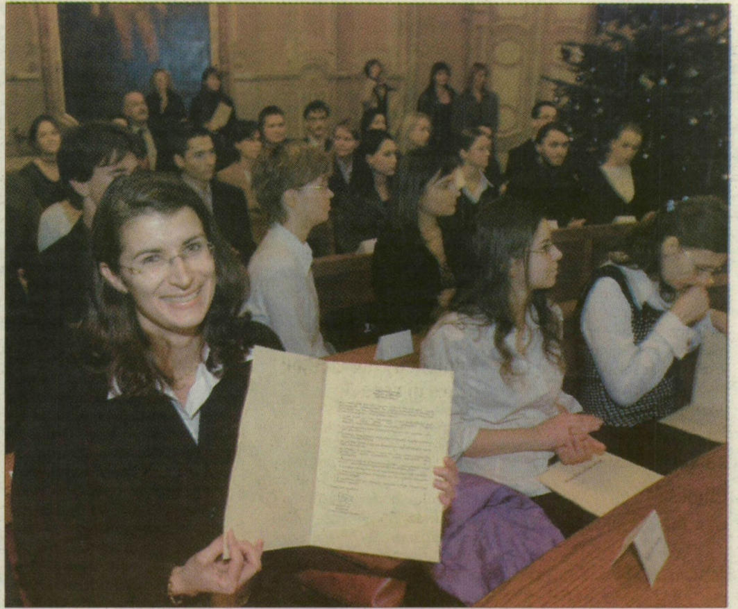
Tíz hónapon át havi tízezer forintot kapnak

Nemcsak tanulmányi átlaggal, hanem szociális alapon is lehetett pályázni ösztöndíjra. A Bursa Hungarica ösztöndíjait havi tízezer forintban részesülnek. Idén kétszázhetvenhárom.