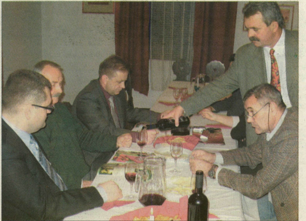
Biztató előjelek a borkóstoláson