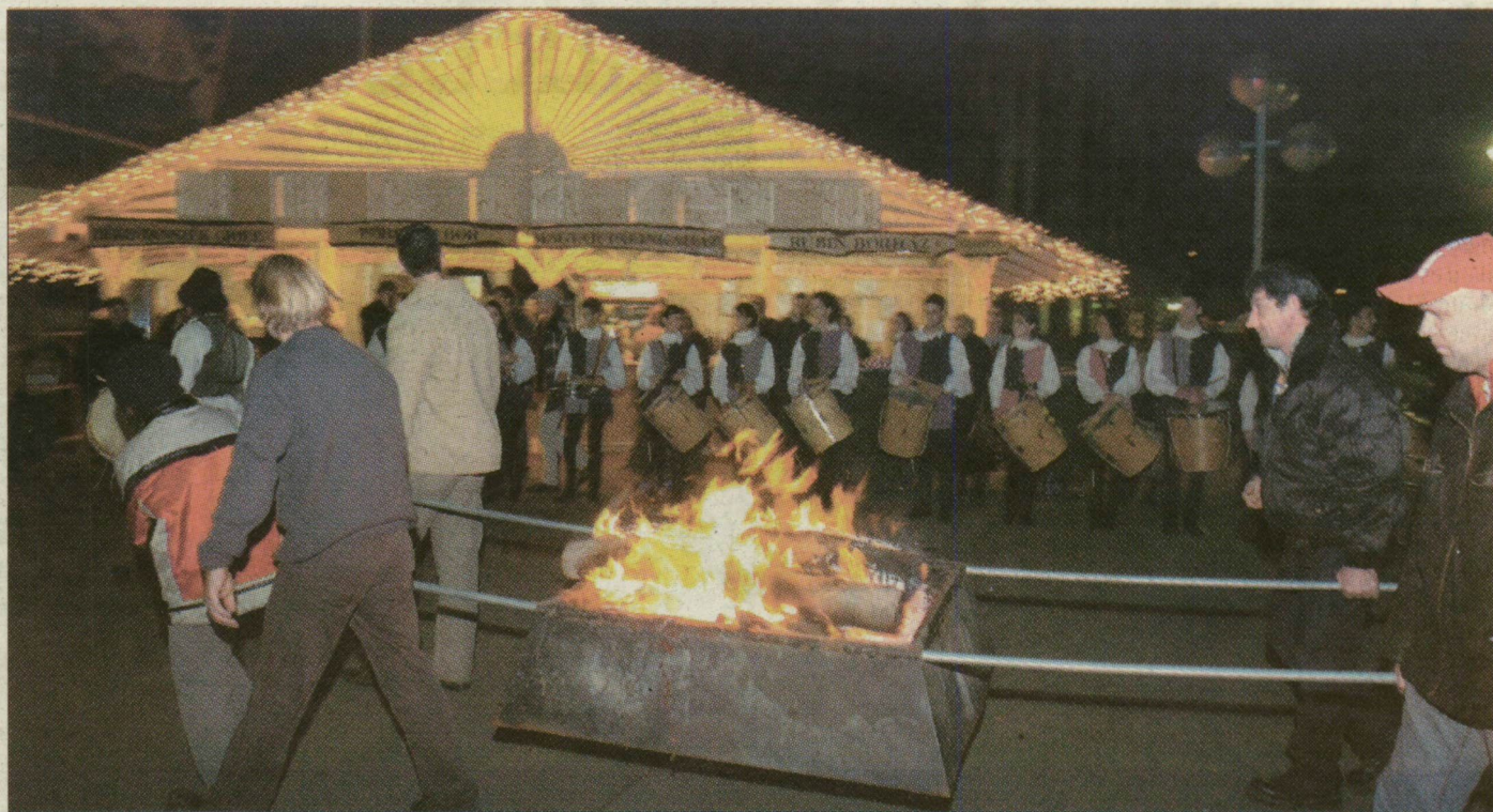
Látványos volt a Dugonics téri vásárnyitás.

Szentestéig keresgélhetnek kedvükre a megfelelő ajándék után a szegediek a tegnap megnyílt karácsonyi vásárban. Idén három belvárosi helyszínen kínálják portékáikat a kereskedők. A választék széles, csak győzze lábball, meleg kabáttal, no meg pénztárcával az ember.