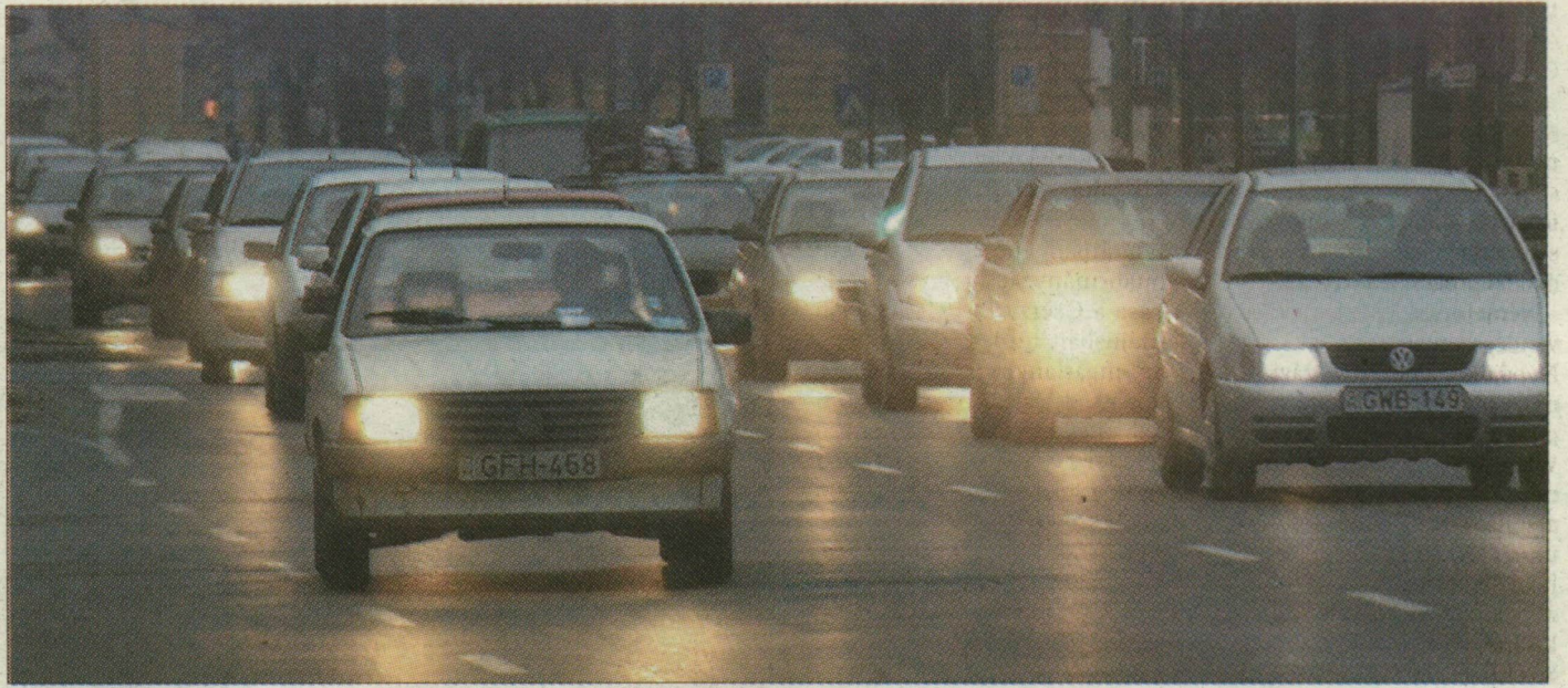
Egyes napszakokban végláthatatlan autósorok alakulnak ki Szegeden is