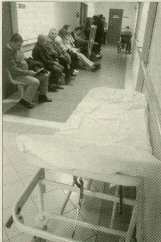
Makón készül az átalakításra, kíváncsian várják a regionális egészségügyi tanács döntését

A közgyűlésen több képviselő is dicsérte a szeptembertől megszüntetett általános iskola tanterületét, a hátrányos helyzetű gyermekek érdekében végzett munkát. Akkor az igazgatónő kijelentette: miután bezárják az iskolát nehéz elhinni, hogy jól végezték a munkájukat. De most arra kell törekedni, hogy a tanulóik ne veszítsenek, csak nyervek ezzel a lépéssel – hangsúlyozta a képviselők előtt.