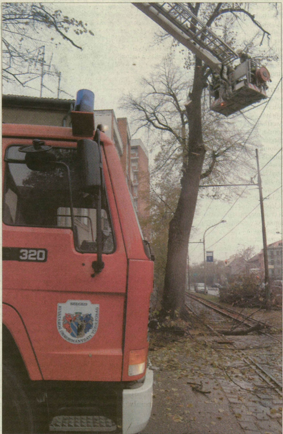
A szegedi 4-es villamos vonalán „helyet csináltak” az áramszedőnek