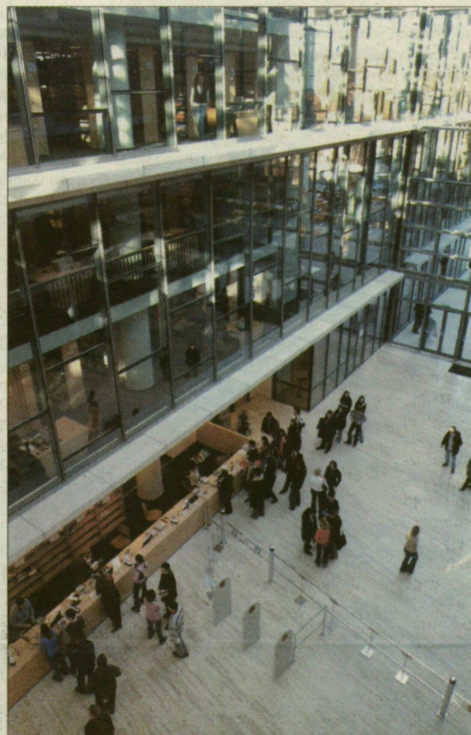
A József Attila Tanulmányi és Információs Központ az Ady téren. A legújabb épület