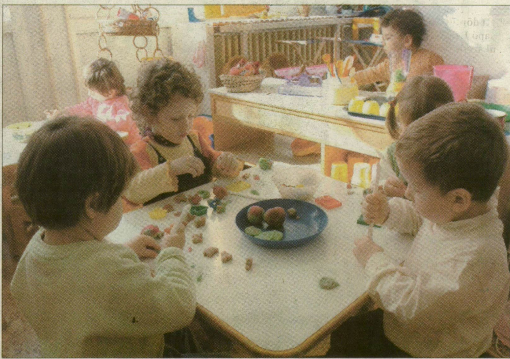
A Füles csoportban tegnap huszonnégyből tizenhatan voltak

■ Új bölcsőde nyitására egyébként a közgyűlés dönthetne – gyerek lenne hozzá. A szegedi várólista hosszú, jelenleg 148-an várnak beiratkozásra.