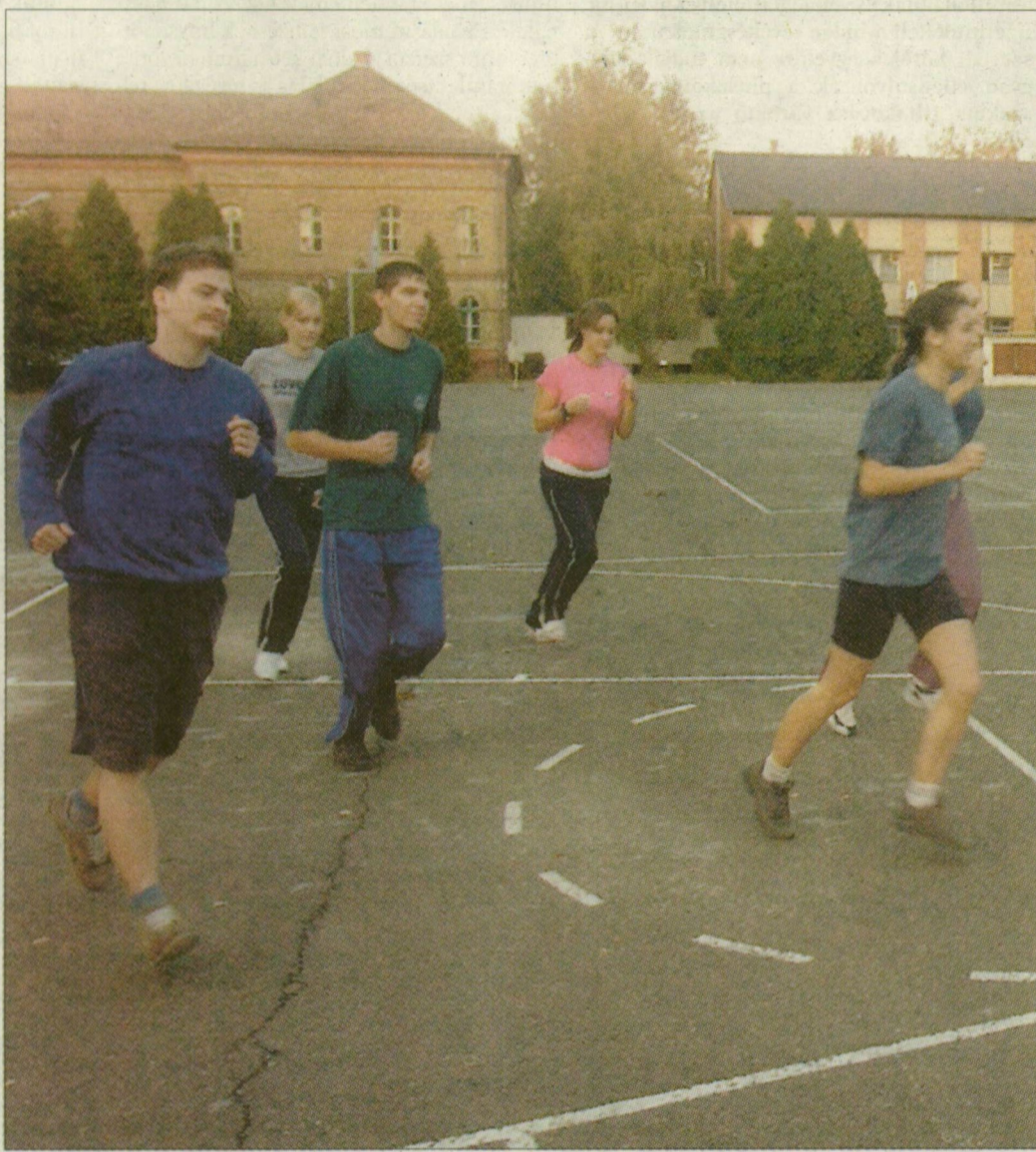
A Hattyas soron tartják az egyetemi testnevelés órákat