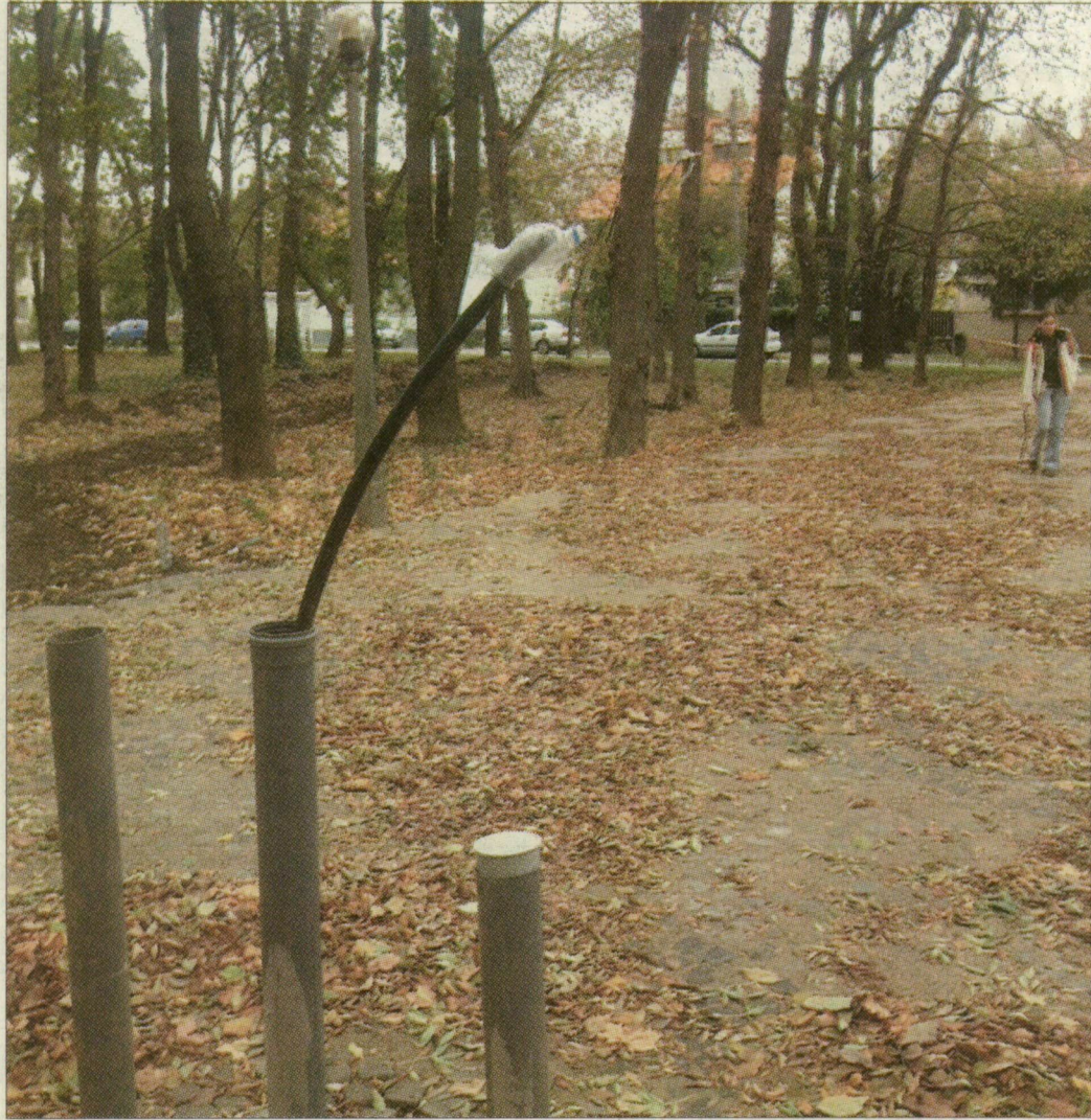
A díszkutat még nem merték kitenni

A tér berendezéseit viszont – az eddigi tapasztalatokból kiindulva – csak a két hét múlva esedékes ünnepélyes avatás előtt, az utolsó pillanatban szállítják ki a helyükre. A napokban teszik ki a pihenőpadokat, és összeszerelik a raktárban várakozó kerti pavil-