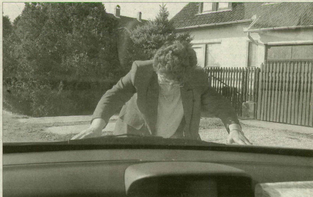
P. J.-né bemutatta, hogyan próbálta az autóját és a benne ülő rablót feltartóztatni

Az asszony egyből tudta: a kendősnek nem a kocsijára, hanem az abban hagyott pénzre van szüksége. – A bolt három napi bevétel, feltöltőkártyák és bérletigazolványok voltak a táskámban és abban a szatyorban, amit a kocsis hátsó ülésén hagytam. Másnap cigarettaszállítmányt és a mobilosokat vártam, ezért volt nálam annyi pénz, amit nem akartam estére az üzletben hagyni. A kendős férfi láttán kialszolni kezdtem, de este hétkor már sötét és kihalt volt az utca – mondta a nő. A tolvajnak egyébként