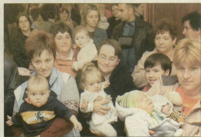
Egy évvel ezelőtt is nagy volt a gyermekáldás Hódmezővásárhelyen

Mától november 16-áig a megye nyolc városában rendezünk baba-fotózást, a pontos időpontok és helyszínek keretes felhívásunkban olvashatók. A makóiakkal kezdünk, aztán holnapról három