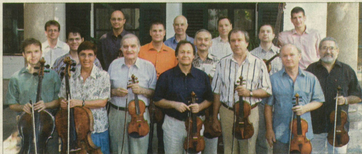
A világhírű együttes Óbudán. Ma este a nagyszínházban lépnek fel