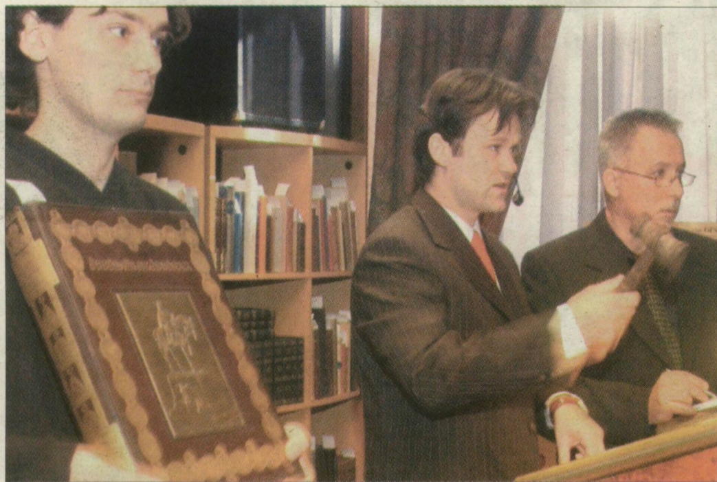
Lecsap a kalapács, elkelt az Árpád és az Árpádok című könyv