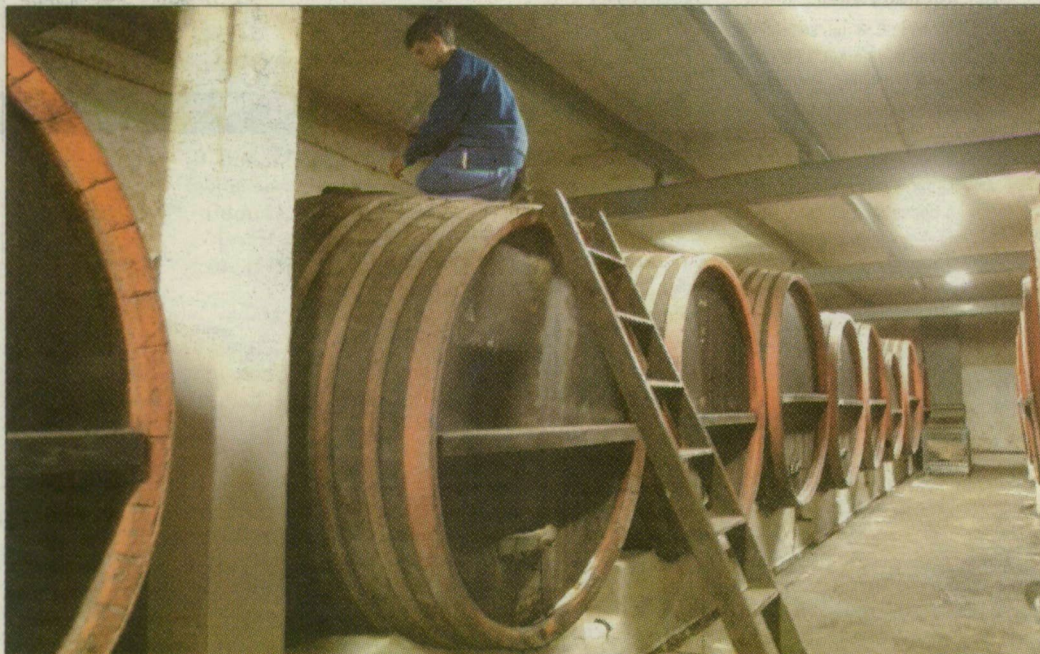
A szüret véget ért, most már csak a pincén és a borászon múlik a minőség