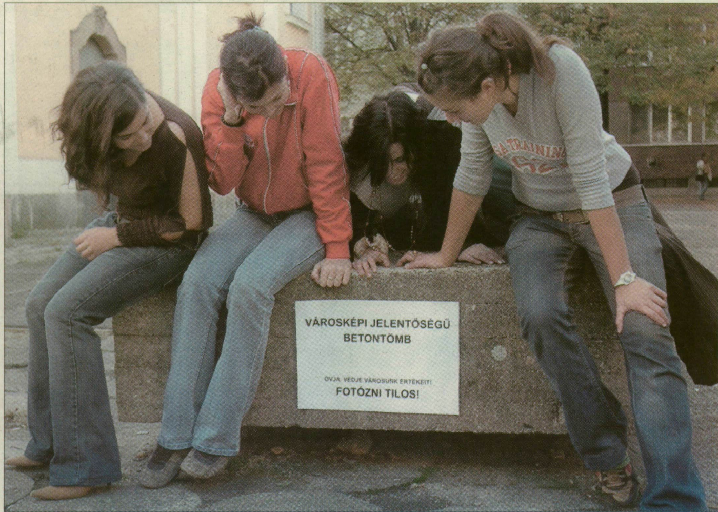
Városképi szépségű lányok. A fáradhatatlan utcai harcos mindenre ragaszt