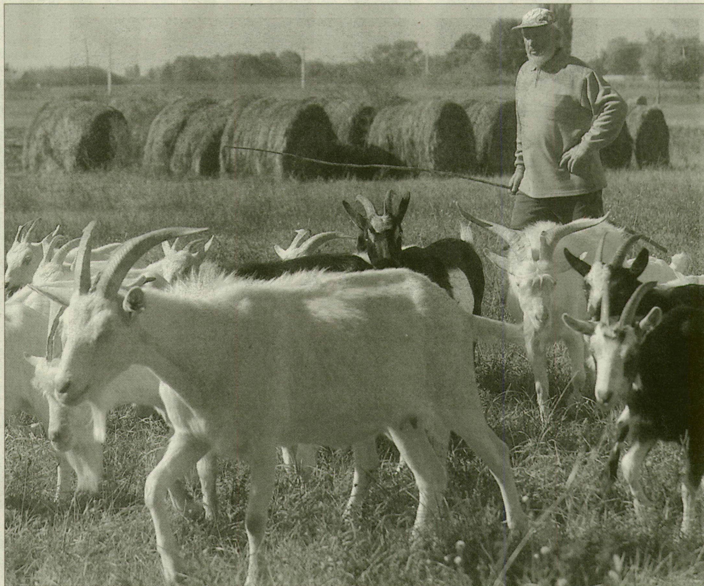
A kecsketartásból szerényen, de meg lehet élni