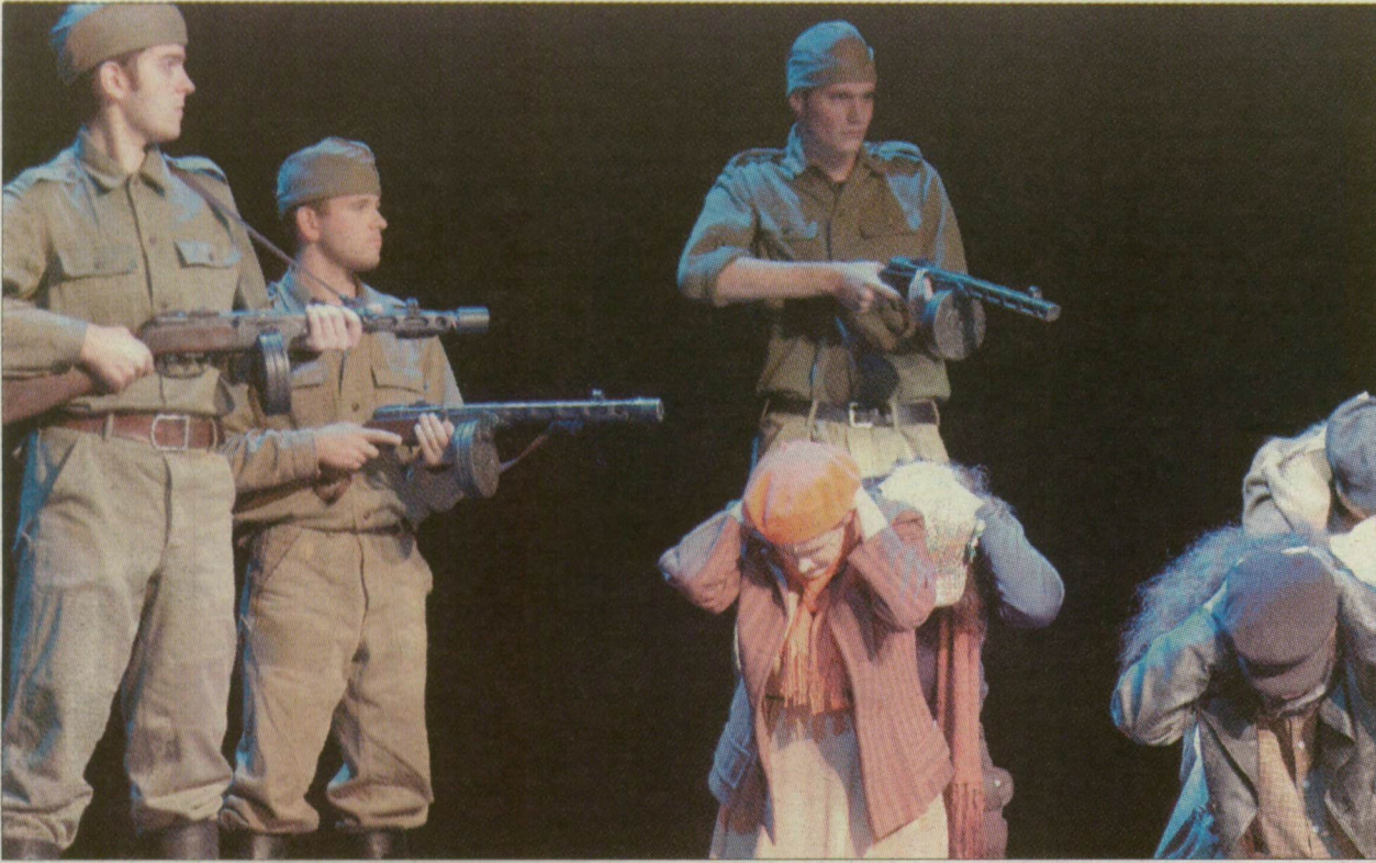
Katonák, fegyverek és civilek. Jelenet a mozgalmas és izgalmas darabból