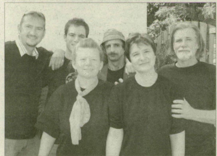
A nyertes csapat

tésükből feleszmélve megünnepelték nyereségüket úgy, hogy a másik Csongrád megyei vetélkedő csapatot, a Mókuskákat is vendégül látták. A nyertesek nem számítottak mindent elsöpítő győzelemre. „Csak úgy” játszottak. Az értékelés, és a nyereség meglepte a csapat siket, il-